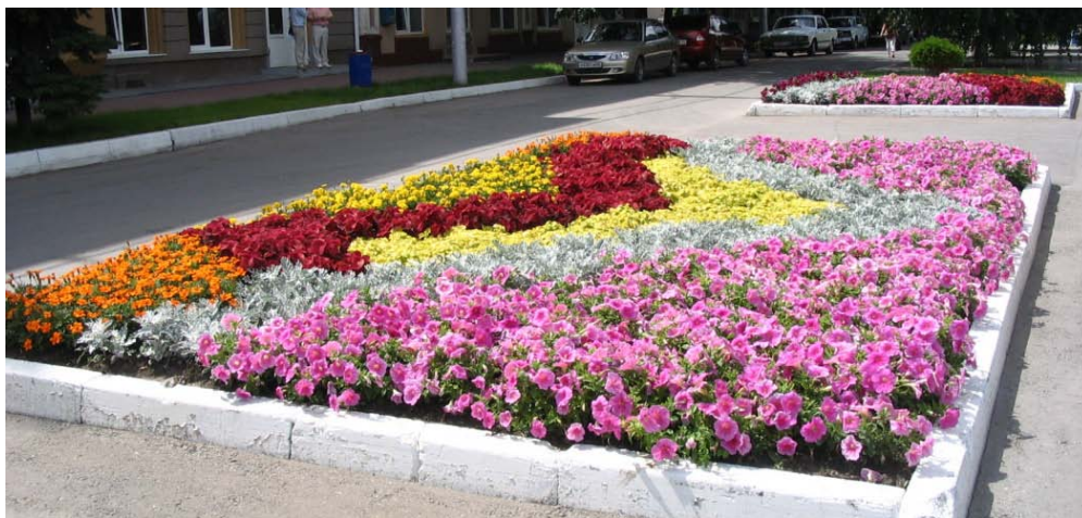
Пример цветочной рабатки

встретить в парках, скверах, на аллеях. Различают односторонние и двусторонние рабатки. Ширина цветочной рабатки варьируется от 50см до 3м. Очень длинную рабатку можно разбить на части дорожками.