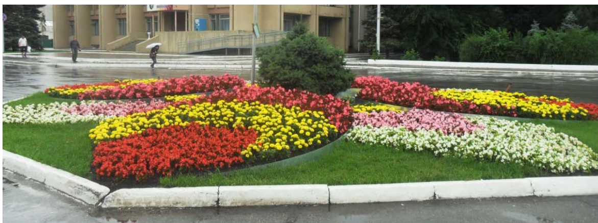
Пример приподнятой клумбы

Клумбы – цветники предпочтительно строгой геометрической формы из многолетних и однолетних культур. Поверхность клумбы бывает ровной и приподнятой. Высота клумбы не должна превышать 50-80см. При подборе растений для клумбы необходимо учитывать гармоничное цветовое сочетание, характер роста цветов и их высоту.