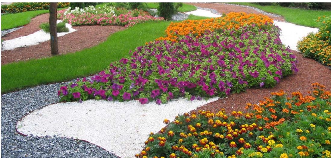
Пример цветочных групп

Группы – наиболее часто применяемый вид посадок. В них могут участвовать как однолетники так и многолетники. Группы из одного вида или сорта называют простыми. Смешанные группы состоят из двух и более видов растений с разными сроками цветения. Группы хорошо сочетаются как с регулярным, так и с пейзажным стилем. Размер группы зависит от дизайнерского замысла и размера участка.